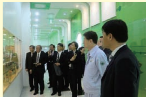
韓国乳業メーカーの視察