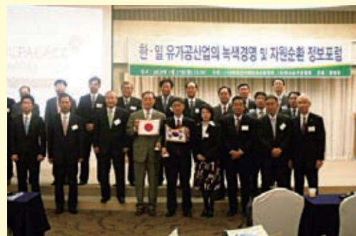
日韓環境フォーラム

容環協では今回の視察で得た情報や成果をこれからの活動に活かしていくとともに、今後も両国間の関係事業者や市民団体との有益な情報交換を図り、紙パックのリサイクル促進に努めていきたいと考えています。