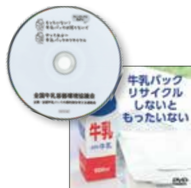
マシンガンズDVD 「牛乳パックリサイクルしないともったいない」

小学生に、牛乳パックのリサイクルと環境についてわかり易く理解してもらうDVDです。①牛乳パックのふるさと、②森林の管理、③木から牛乳パックへ、④牛乳パックの特徴、⑤飲んだらリサイクル、の5つの内容を、牛乳パックンが説明してくれます。子どもたちに親しみを持って見てもらえる内容になっていますので、環境について考え、自ら行動することの大切さを学ぶ教材としてご活用ください。お申込みいただいた学校・団体には無料配布しています。