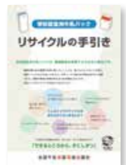
学校給食用牛乳パック リサイクルの手引き

マシンガンズによる牛乳パックのリサイクルをゆる〜く解説したDVDです。語りはゆる〜くしていますが、内容はいたってまじめに作ってありますので、子どもから大人まで楽しんで見ながらリサイクルを学ぶことができるDVDになっています。「もったいない！牛乳パックは捨てないで」と「やってみよ〜牛乳パックのリサイクル」の2部構成になっていて、それぞれ約8分の動画です。このDVDもお申込みいただければ無料配布いたします。