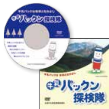
牛乳パックン探検隊DVD

紙パックの特性やリサイクルを わかりやすく学べるDVDや リーフレットを提供しています。