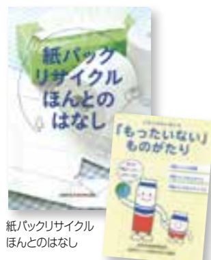
紙パックリサイクル ほんとはなし